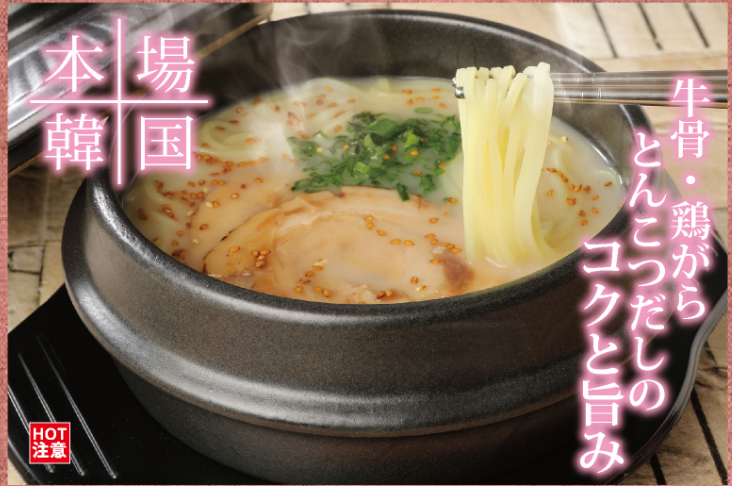
コムタンラーメン | ¥980 (税込)