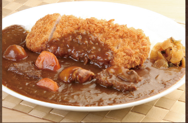
ロースカツカレー | ¥980 (税込)