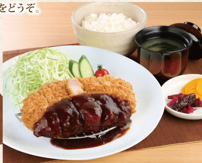
ロースカツ定食 (ごはん・味噌汁・漬物付) | ¥1,080 (税込)