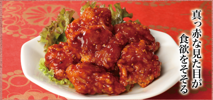
旨辛ヤンニョムチキン | ¥880 (税込)