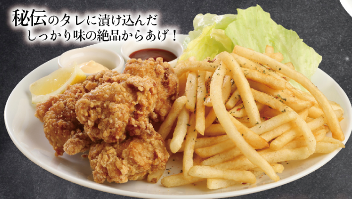
山盛りからポテプレート ¥880 (税込)