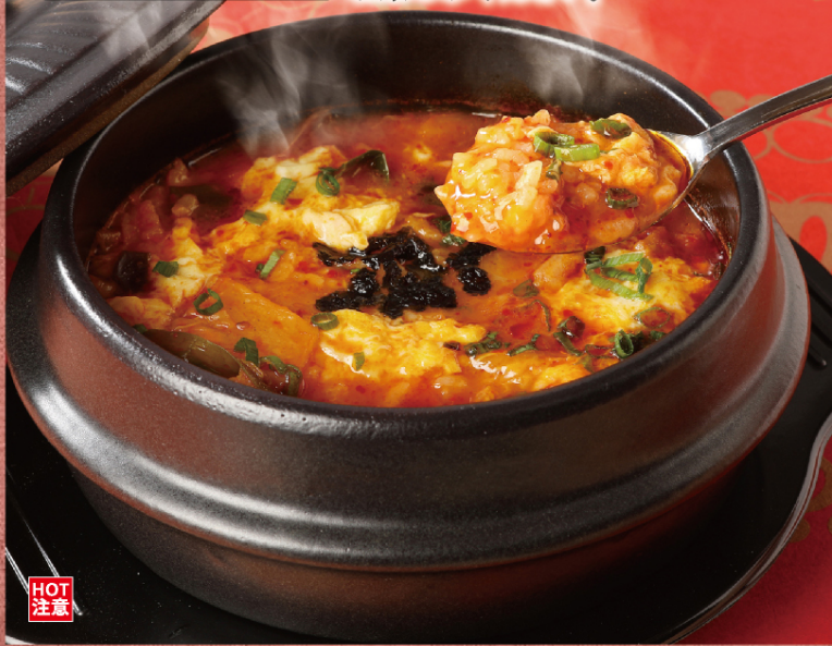
ユッケジャンクッパ | ¥1,180 (税込)

肉と野菜の旨味が絡み合った、 ピリ辛の「ユッケジャンクッパ」を お楽しみください。