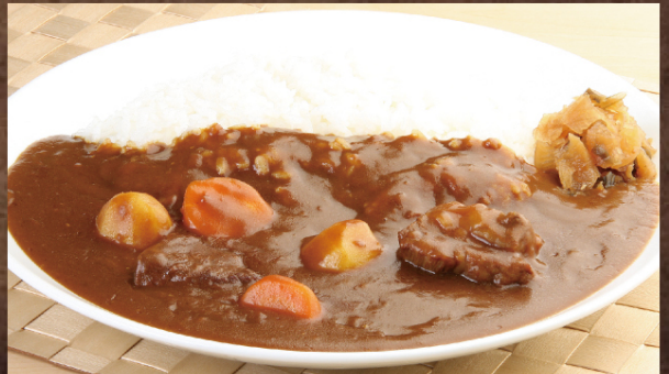
ビーフカレー | ¥680 (税込)