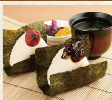
おにぎりセット | ¥380 (税込) (味噌汁・漬物付)