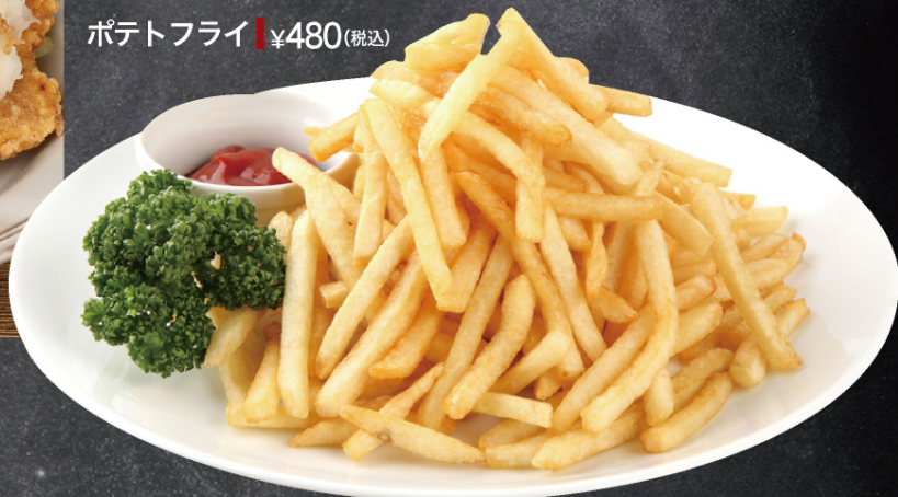
ポテトフライ ¥480 (税込)