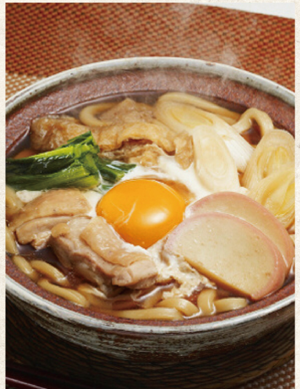
銅焼きうどん | ¥780 (税込)