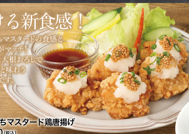
ぷちぷちマスタード鶏唐揚げ ¥880 (税込)

ぷちぷちマスタードの食感と 唐揚げがマッチ！ ボン酢と大根おろしで さっぱりと味わう 唐揚げです。