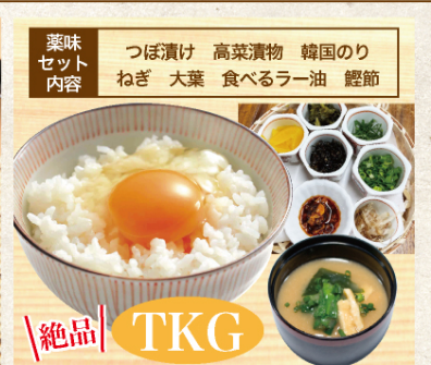
たまごかけごはん | ¥380 (税込) (味噌汁・薬味セット付)