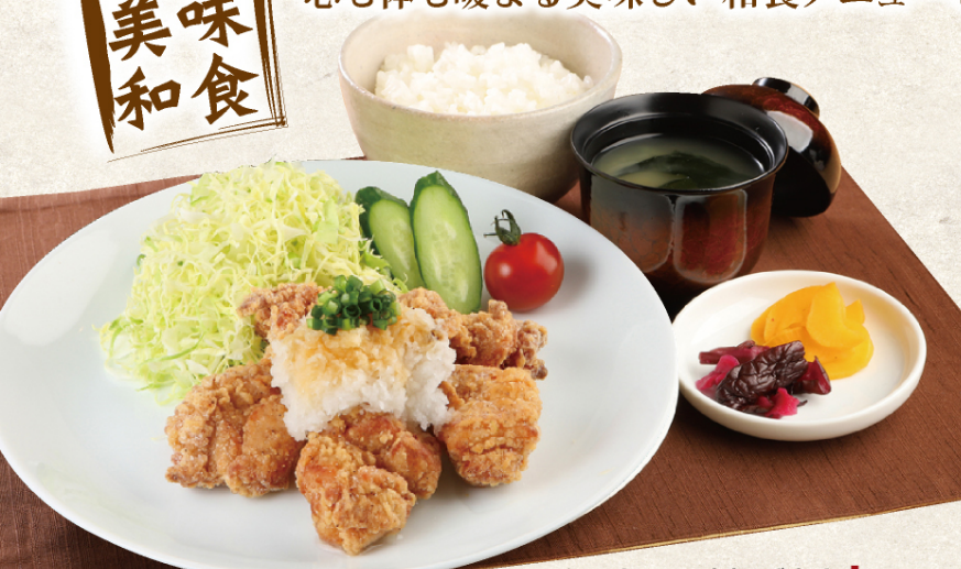
和風おろし唐揚げ定食 | ¥980 (税込) (ごはん・味噌汁・漬物付)