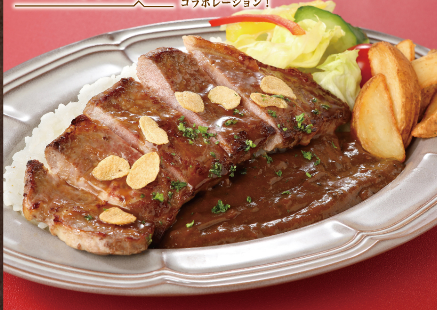
サーロインステーキカレー | ¥1,680 (税込) ※お肉は柔らかくするために牛脂を加える加工をしています。

にんにくと果実の濃厚な味わいのカレーと 特製ソースで焼き上げたステーキの コラボレーション!