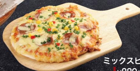
ミックスピザ ¥880 (税込)